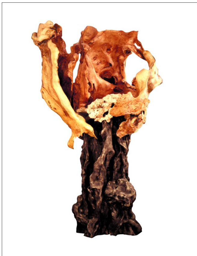
Композиция "Израненная Чечня". 1996 год.

В композиции "Израненная Чечня" художник создает яркий образ своей страны во время войны. Дуб, пораженный молнией, не сдался и не погиб. Его корни углубились в скалу и камни, в поисках влаги и жизни. 10