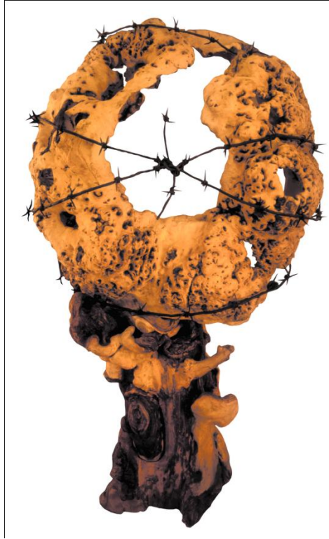
Композиция "Планета Земля". 2000 год.

Скульптура "Планета Земля" также символизирует бесконечные войны на нашей планете. В ней Татаев обмотал колючей проволокой огромный кап, но в центре композиции - гвоздика, символ мира. Этим художник снова подчеркивает сущность своего творческого мировоззрения: люди – часть этой планеты, а не ее правители, и должны раскрывать ее чудеса через любовь.